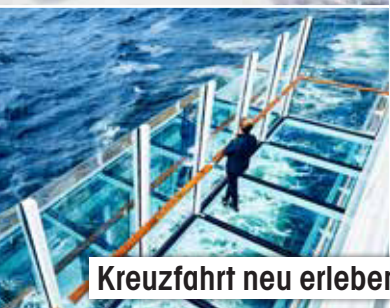
Kreuzfahrt neu erleben